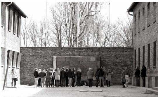
Młodzież I LO przy bloku Śmierci (Auschwitz), 2015.

Program wychowawczy I Liceum Ogólnokształcącego dopuszcza wycieczki: są to wyjazdy wynikające z założeń programowych poszczególnych klas. I