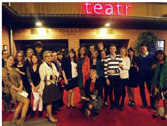
Wyjazd do Wrocławia na przedstawienie „Mistrz i Malgorzata”, 2014.

Rossie, Kowno, Troki), Lwów (Cmentarz Łyczakowski, Orląt Lwowskich).